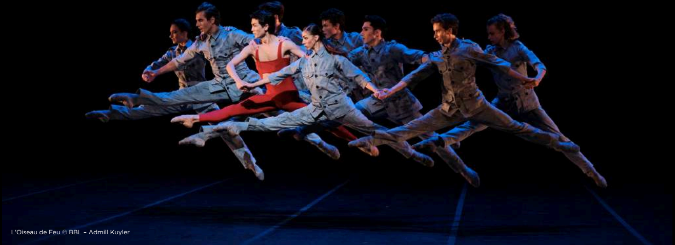
L'Oiseau de Feu