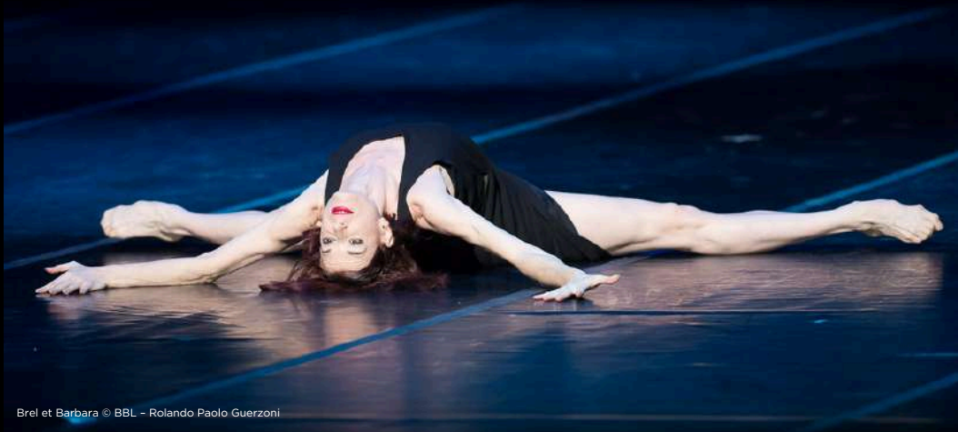
Brel et Barbara